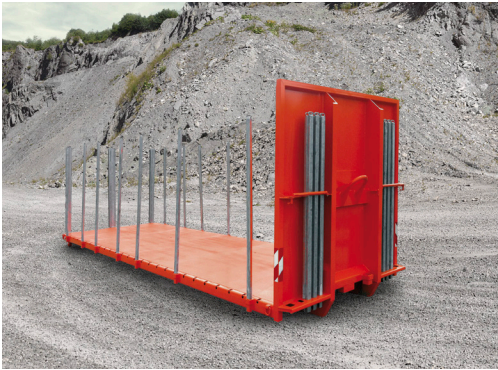
Steckbare Rungen mit Depot