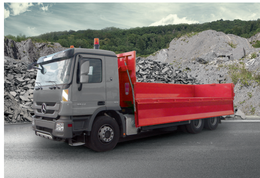
Federentlastende Seitenwand aus Stahl